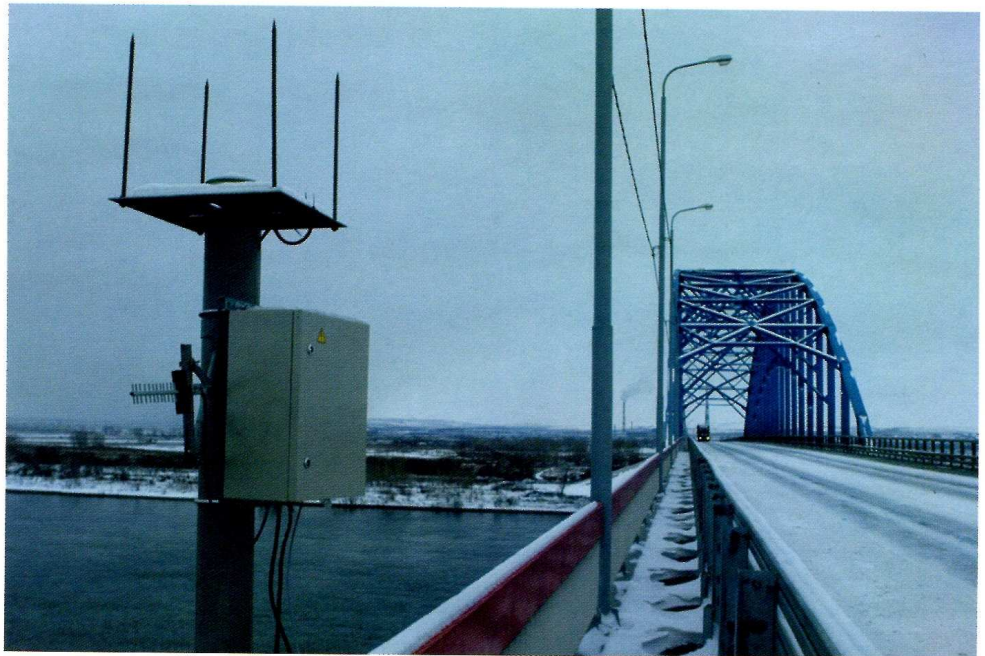
Система мониторинга моста через реку Енисей вблизи Красноярска

Однако при возникновении критической ситуации такие измерения не позволяют получать оперативные данные, а также не несут достаточной информации для расчета действительных текущих динамических характеристик сооружения для сравнения с их проектными значениями. Поэтому в настоящее время актуальной задачей является разработка постоянно действующей системы, способной осуществлять сбор, систематизацию, хранение, анализ, преобразование, отображение и распространение пространственно-координированных данных о контролируемых элементах сооружения во время эксплуатации. Кроме того, мониторинг таких сооружений, как мосты с пилонами высотой в сотни метров, необходимо осуществлять уже на этапе строительства. Выполнять мониторинг пилонов необходимо перед выносом проекта в натуру, поскольку конструкции по мере возведения начинают испытывать нагрузки от влияния изменения температуры, ветра и нарастающего собственного