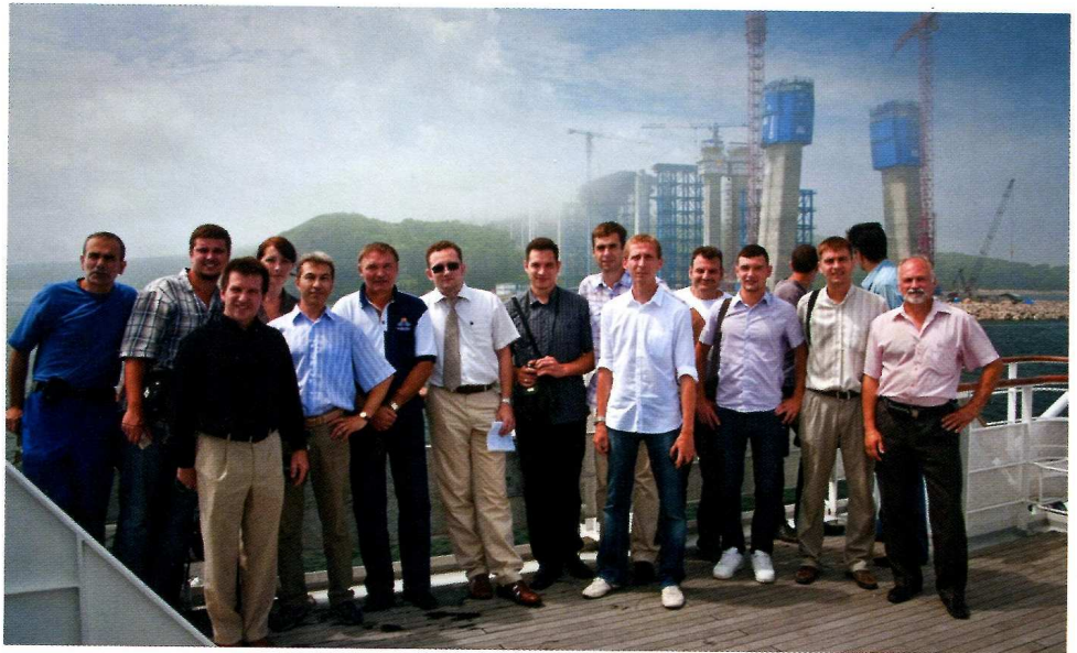
Участники семинара по мониторингу мостов в августе 2010 г. в г. Владивосток

Комплекс аппаратно-программных средств должен включать в себя спутниковое геодезическое оборудование, высокоточные измерители углов наклона (инклинометры), геотехнические датчики, электронные тахеометры, коммуникационную аппаратуру, компьютерное оборудование, а также программное обеспечение для управления средствами сбора, обработки данных, визуализации определяемых параметров, анализа результатов и формирования отчетов и сообщений. АСДМ должна включать набор датчиков, установленных в критических точках элементов конструкции мостового сооружения. Инфраструктура, обеспечивающая работу комплекса аппаратно-программных средств, должна включать центр управления системой, оборудование, систему электропитания и систему коммуникаций.